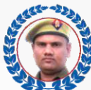
Chetan UP POLICE